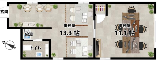
オフィス什器配置の参考例

玄関側の応接・待合スペースと、奥のデスクが並ぶ執務エリアに完全分離でき、来客対応と業務の効率化を両立できる配置です。