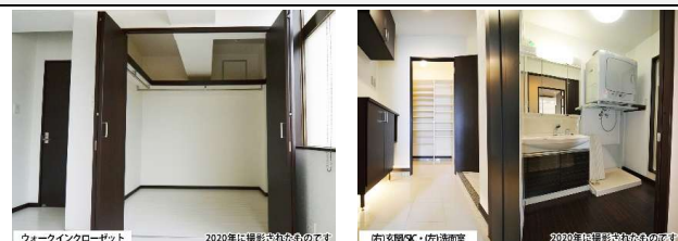
ワークインクローゼット

1フロアに1邸ならではの高い独立性。視線や生活動線が重ならない、那覇で叶える戸建のような快適・上質な私邸のような空間設計